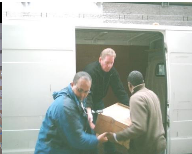
Chargement des livres