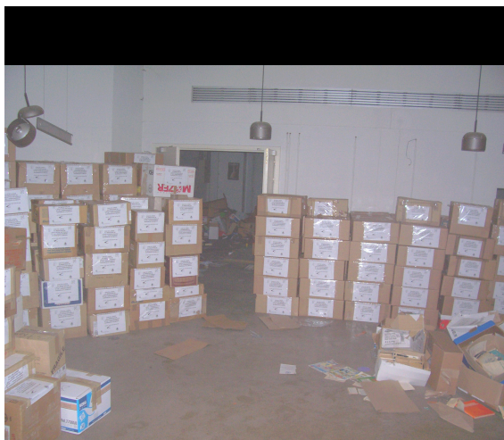
Emballage des livres