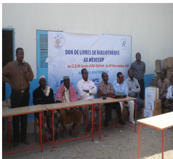
Cérémonie de remise de don de livres au CEM/Lycées d'ali-Sabieh