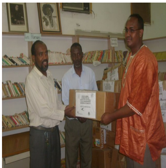
Rémise des livres au directeur de la pédagogie du MENESUP.